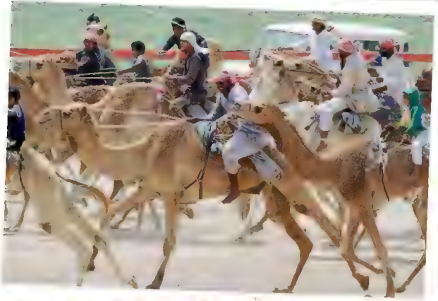
للجمال الهريّة لسوّة فاتحةٌ وقوامٌ دقيقٌ. إنّها أكثرُ الجِمالِ أناقةً، وَيستخدِمُها البدوُ في السِّباقاتِ التي يتولَّعون بها.